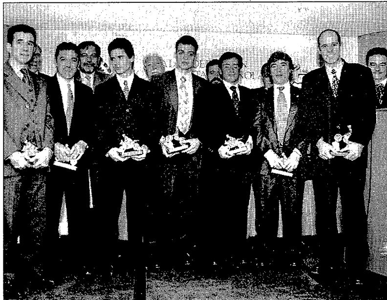
Las motos han dado 30 mundiales a España y en la fiesta de la RFEM sólo faltó Tormo, internado en Valencia

Los campeones homenajeados fueron Ángel Nieto (12+1), Jorge Martínez 'Aspar' (4), Sito Pons (2), Ricardo Tormo (1), Àlex Crivillé (1) y Manuel 'Champi' Herreros (1), en motociclismo, y Jordi Tarrés (7) y Marc Colomer (1), en trial. Entre todos ellos suman 30 títulos mundiales. Igualmente hubo distinciones para los equipos que obtuvieron el campeonato del mundo por marcas como Derbi (7) y Bultaco (4) en velocidad, Gas Gas (1) en Enduro y Bultaco (5), Montesa (3) y Gas Gas (3) en trial.